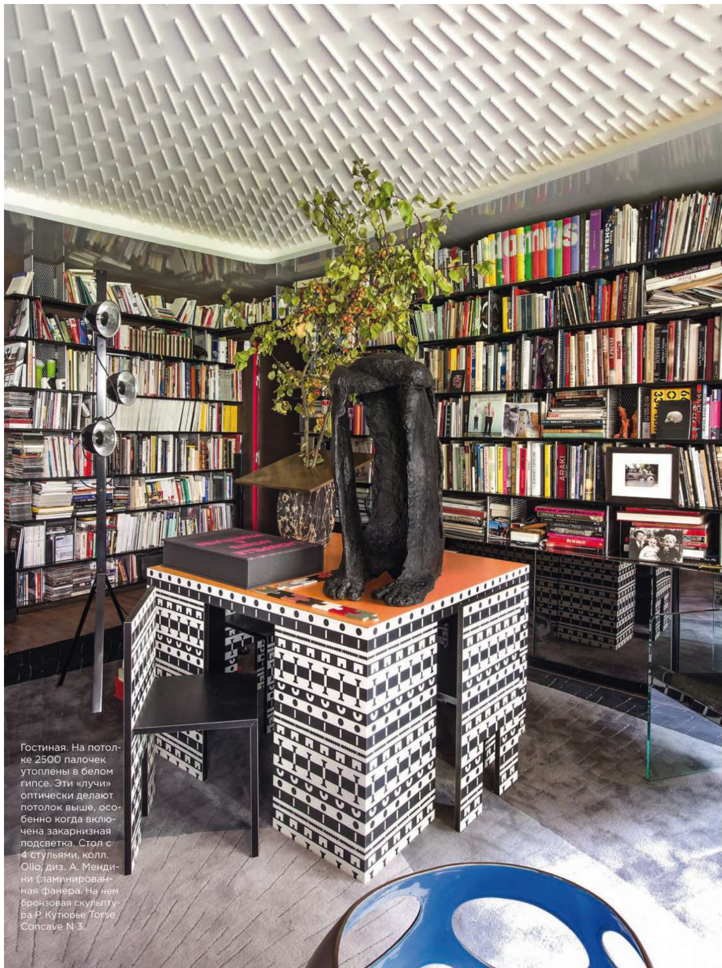
Гостиная. На потолке 2500 палочек утоплены в белом гипсе. Эти «лучи» оптически делают потолок выше, особенно когда включена закарнизная подсветка. Стол с 4 стульями, колл. Ollo, диз. А. Мендини (ламинированная фанера). На нем бронзовая скульптура Р. Кутюрье Torse Concave N 3.