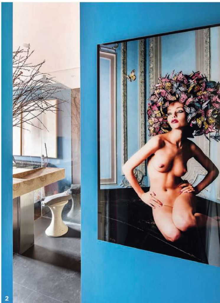
1. Широкий проем соединяет столовую с гостиной. 2. Вход в ванную комнату. Фотография Д. ЛаШапеля Nature's Naked Loveliness . 3. Мозаика П. А. Пулена. 4. Керамические скульптуры Odalisca и Burma , автор — Э. Соттсасс.