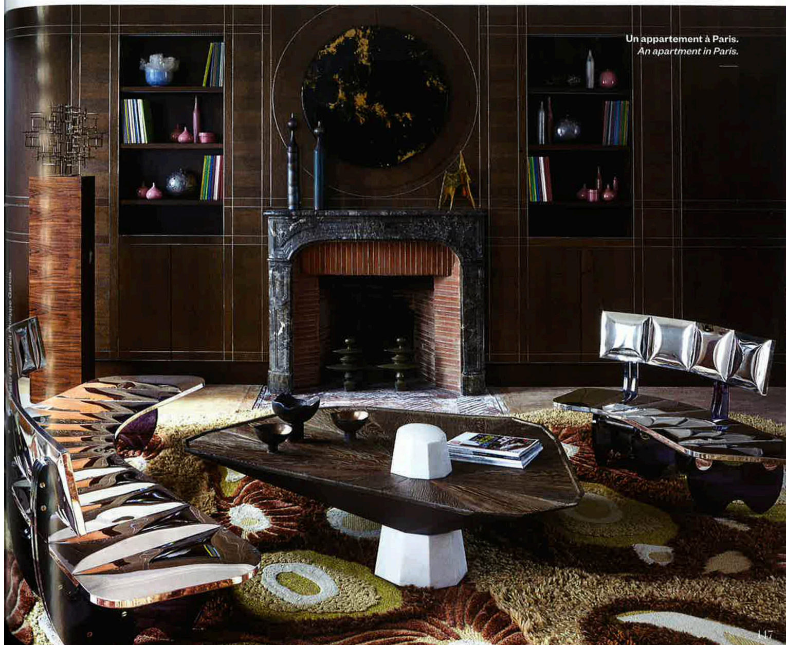
Un appartement à Paris. An apartment in Paris.